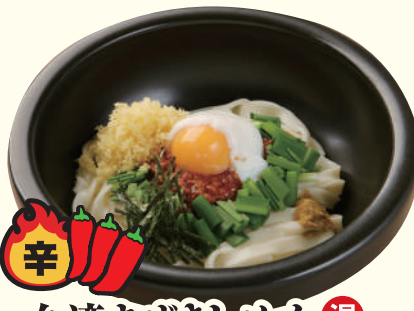
辛 台湾まぜきしめん 温 (追い飯付) 1,300円(税込)