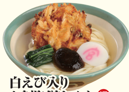
白えび入り かき揚げきしめん 温 ..... 980円(税込)