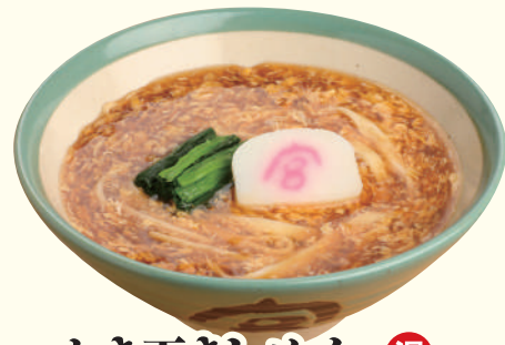
かき玉きしめん 温 ..... 980円(税込)