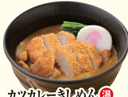
カツカレーきしめん 温 ..... 1,380円(税込)