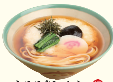
とろろきしめん 温 ..... 950円(税込)