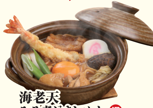
海老天 みそ煮込きしめん 温 ..... 1,480円(税込)