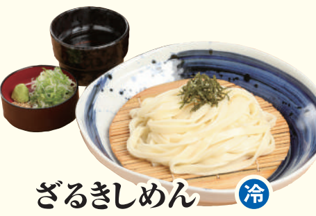
ざるきしめん 冷 ..... 850円(税込)