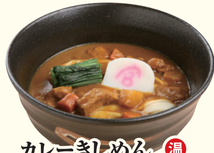
カレーきしめん 温 ..... 1,030円(税込)