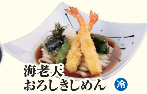
海老天 おろしきしめん 冷 ..... 1,350円(税込)