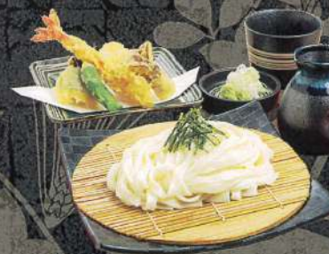
天ぷら付き ざるきしめん 冷 1,430円 (税込)