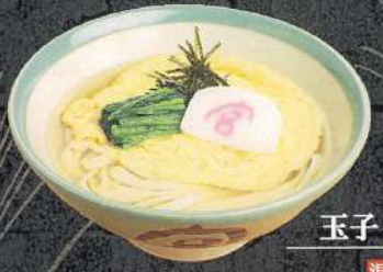
玉子とじきしめん 温 980円 (税込)