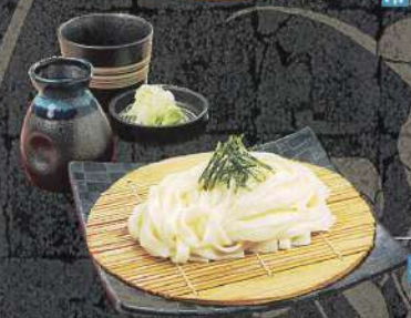
ざるきしめん 冷 880円 (税込)