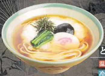
とろろきしめん 温 980円 (税込) 冷 1,080円 (税込)