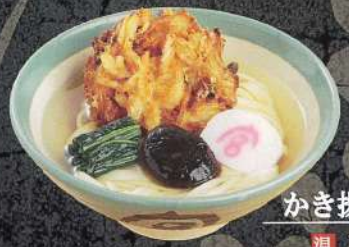
白えび入り かき揚げきしめん 温 1,030円 (税込)