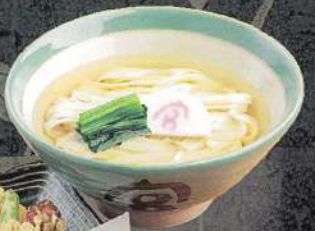
天ぷらきしめん 温 1,300円 (税込)