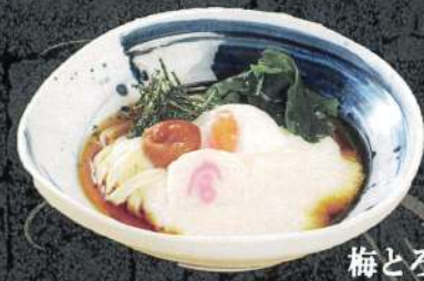
梅とろ玉きしめん 冷 1,180円 (税込)

天ぷら盛合せ (5種) 650円 / 温玉 180円 海老天ぷら (1本) 280円 / とろろ 200円 白えび入りかき揚げ 280円