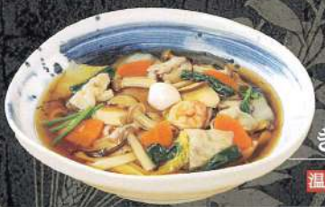
五目あんかけ きしめん 温 1,200円 (税込)

天ぷら盛合せ (5種) 650円 / 温玉 180円 海老天ぷら (1本) 280円 / とろろ 200円 白えび入りかき揚げ 280円