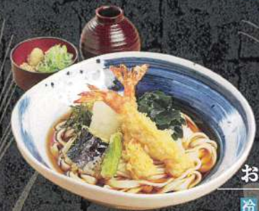
海老天 おろしきしめん 冷 1,430円 (税込)