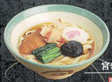
宮きしめん 温 880円 (税込) 冷 980円 (税込)